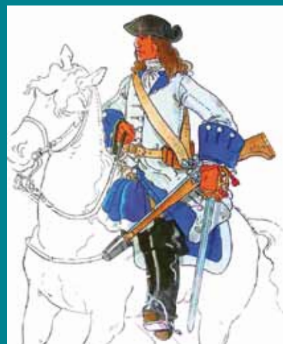
Soldat del Regiment Nebot

Els més avançats, per la part de l'interior, caigueren alegrement sobre Torres, creient que se les havien amb pocs voluntaris muntats. Quan s'adonaren de l'error, 80 dels francesos jeien per terra com a resultat d'una càrrega arrasadora. Els supervivents es dispersaren turons amunt. La topada per la costa, que coneixem per una puntual relació de l'encontre, fou d'un altre signe i tingué un gran sabor cavalleresc. Els borbònics veieren clarament ençà del congost l'avançada de la columna Aguilar i advertiren que era força reglada. Els esquadrans francesos estrenyeren els rengles i avançaren al pas, amb els mosquets desenfundats. El seu comandant agità el capell en