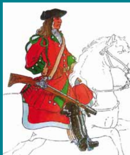
Soldat del Regiment de la Fe