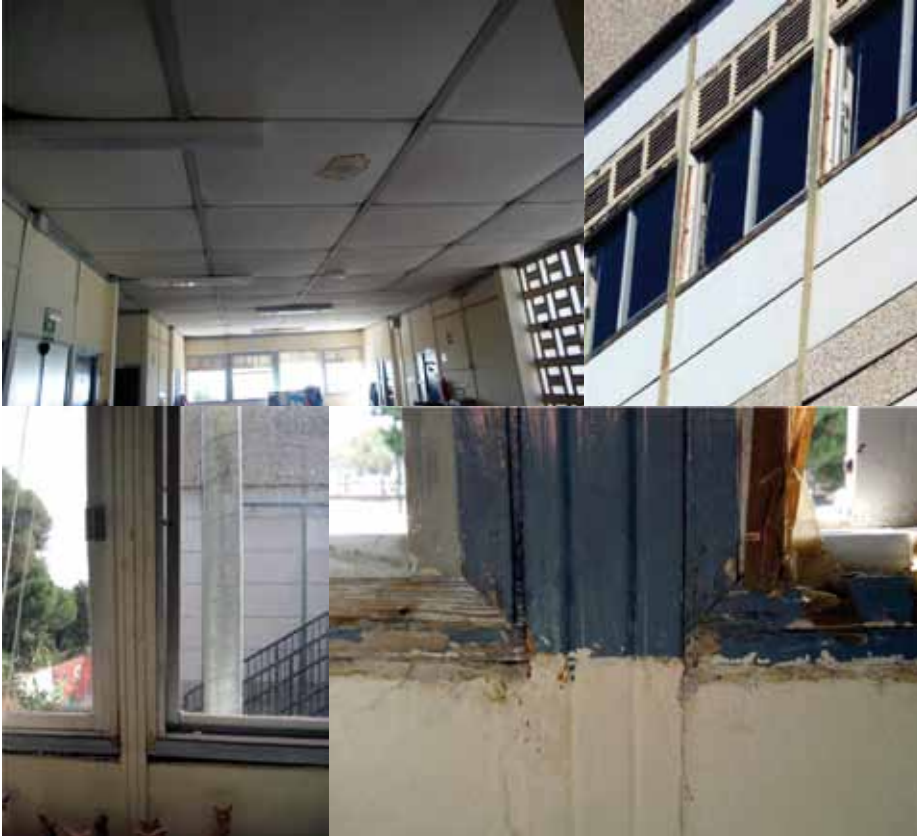
Algunes mostres del mal estat de l'edifici escolar

La façana, els lavabos, totes les finestres i els aïllaments de l'escola es renovaran de dalt a baix quan finalitzin les classes d'aquest curs escolar, si s'acompleixen les previsions del Govern Municipal, que ja ha aprovat el projecte bàsic d'execució a la seva reunió del passat 4 de gener de 2014.