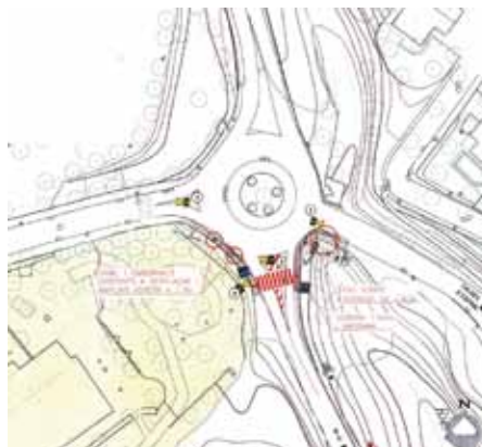
Cruïlla de Can Marial entre la carretera que va de St. Vicenç a la N-II i la que ve des del nucli de Caldes

La Diputació és a punt d'iniciar les obres gràcies a un conveni que es signarà entre les tres administracions implicades: la pròpia Diputació i els ajuntaments de Sant Vicenç i Caldes, que recull les obligacions de manteniment i conservació de cadascú.