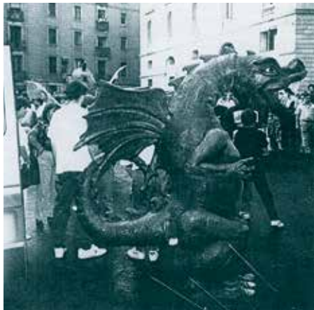
A baix: El drac de Caldes a les Festes de la Mercè de Barcelona, l'any 1990

tructor de Cardona que anteriorment ja havia restaurat els gegants de Caldes i construït "el Nano"), la creació d'una bèstia que acompanyés la cort dels diables. El drac va ser presentat oficialment per la Colla de Geganters durant la Festa Major del mateix any. I va ser així com va néixer el drac de Caldes , avui dia un dels elements més emblemàtics de les festes del municipi.