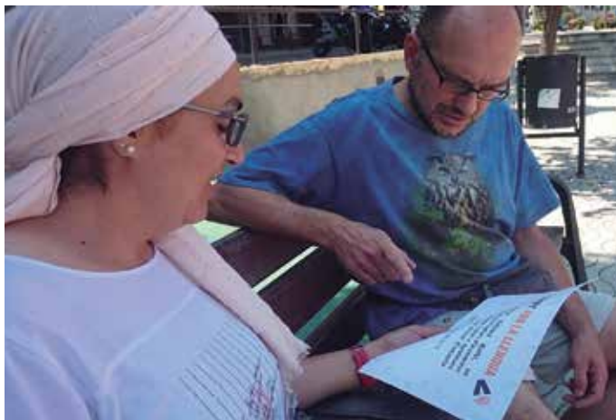
L'any passat 3 parelles van participar de forma satisfactòria al programa Voluntariat per la llengua obtenint el certificat corresponent

La Biblioteca Can Milans col·labora amb el Centre de Normalització Lingüística des de l'any 2011 i posa a la vostra disposició tota la informació i orientació per inscriure's al programa.