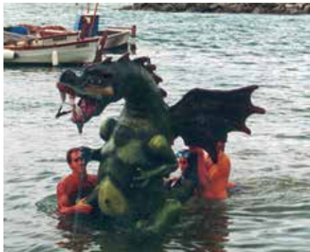
A dalt: preparatius, a la platja de les Barques, per a la presentació del drac durant la Festa Major de 1990