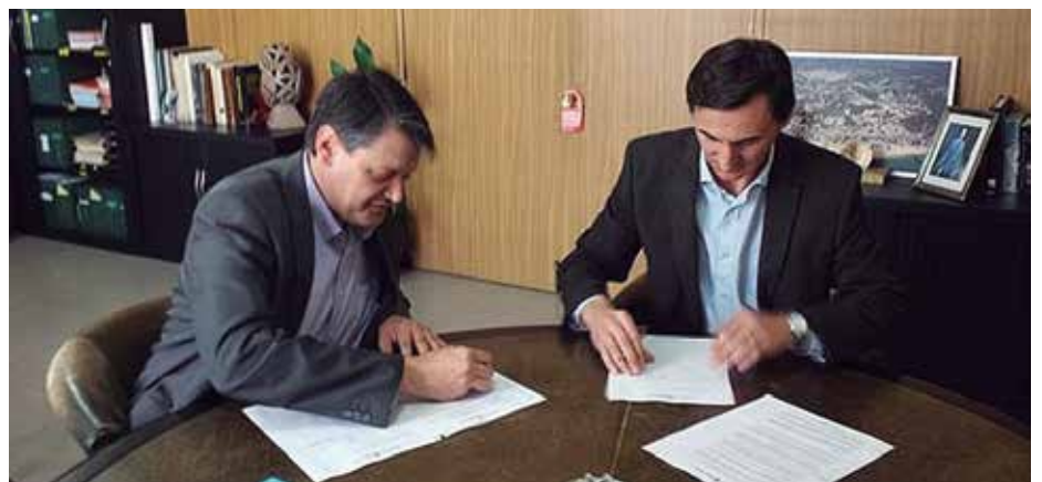
Signatura del conveni realitzat durant el mes de març

■ L'aportació de Sorea ha estat fruit de l'acord de col·laboració signat durant el mes de març entre l'Ajuntament de Caldes i l'empresa, per tal de fer front a la pobresa energètica. Concretament la companyia ha aportat 4.000 euros a fons socials destinats a