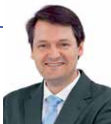
Joaquim Arnó i Porras Alcalde